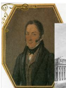
Осип Иванович Бове (Джузеппе Бова)