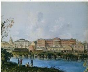
Акварель неизвестного художника Московский университет и река Неглинная 1790-е гг.

До XVIII века на месте Александровского сада протекала река Неглинная, через которую было переброшено четыре моста: Кузнецкий, Петровский, Воскресенский и Троицкий. На территории современного Александровского сада в середине XVI века располагался Аптекарский сад. По повелению Ивана Грозного в нем были посажены плодовые деревья, выращивались лекарственные травы, был разбит огород. Аптекарский сад просуществовал у стен Кремля до 1706 г. и был переведен на 1-ю Мещанскую улицу по указу Петра I, который занимался укреплением стен Кремля бастионами. На берегах реки исторически устраивали народные гуляния, её вода была чистой и славилась рыбным промыслом. Со временем река стала загрязняться, побережье обваливалось и зарастало. В конце XVIII века Неглинная была пущена по каналу.