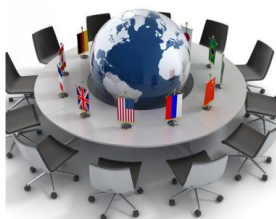
Современные переговорные площадки