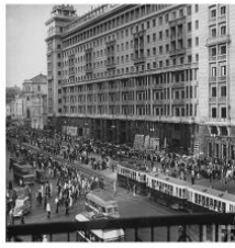
22 июня 1941 года было выходным днем.