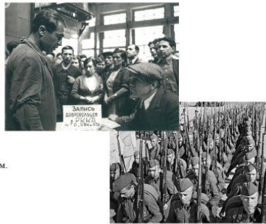
22 июня 1941 года запись добровольцев на фронт.