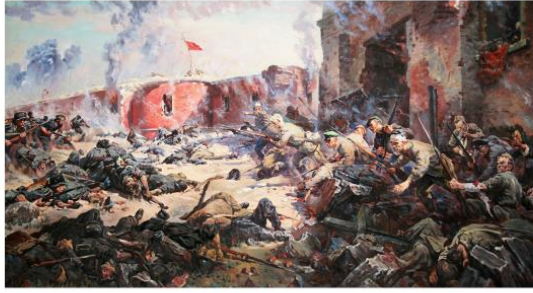
«Защитники Брестской крепости». Художник П.Кривоногов, 1951 г.