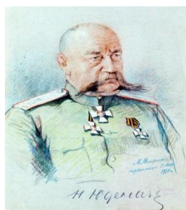
Юденич Николай Николаевич (1862-1933)

Интересно, что за все время Первой мировой орден Святого Георгия Победоносца 1-й степени ни разу не вручался. А вот 2-й класс награды сумели заслужить всего четверо российских военнослужащих. Ими стали Великий князь Н. Н. Младший, занимавший в то время пост Главнокомандующего русской армией, а также начальники фронтов – генералы Н. Иванов, Н. Рузский и Н. Юденич. Самым известным был последний из них, который после революции 1917 года возглавил белое движение в северо-западной части России. В Первую мировую Юденич воевал против турецкой армии на Кавказском фронте. Свой первый орден Георгия Победоносца 4-й степени он заработал во время Сарыкамьшской операции, завершившейся в январе 1915 года. Следующие свои награды генерал получил также за борьбу с турками: 3-й класс – за разгром части вражеской армии, а 2-й – за взятие Эрзерума и Деве-Бейнской позиции.