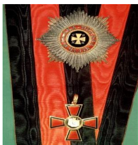
Звезда и знак 1-й ст.

Императорский орден Святого равноапостольного князя Владимира в 4-х степенях.