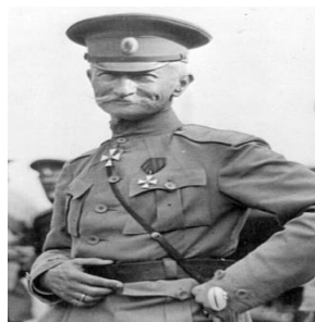
Брусилов Алексей Алексеевич (1853-1926)