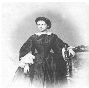
Мария София Амалия (1841-1925)