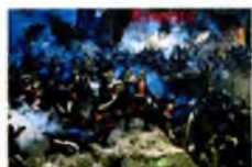
Победа русского оружия

благодаря которым школьники смогут быстрее найти ответы на вопросы.