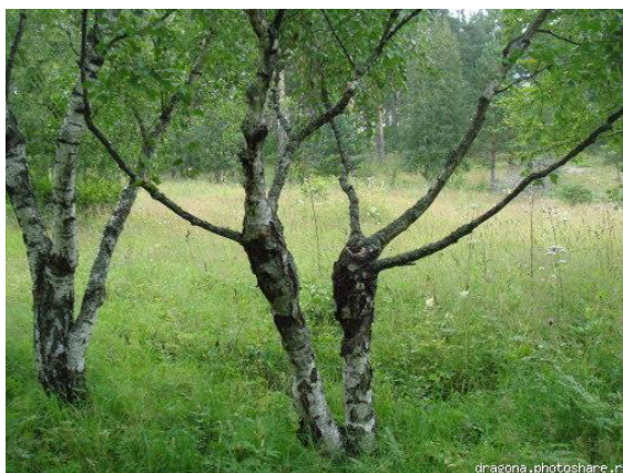
Береза средней полосы