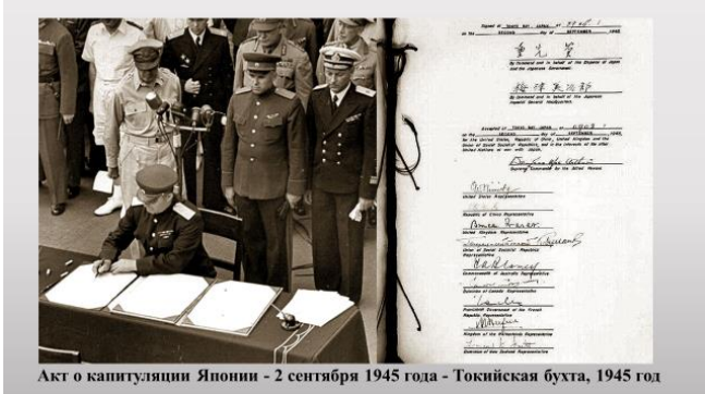
Акт о капитуляции Японии - 2 сентября 1945 года - Токийская бухта, 1945 год

Прочитайте один из эпизодов Советско-японской войны и отрывок воспоминания участника военной кампании на Дальнем Востоке 1945 года. Подготовьте вопросы, которые вы могли бы адресовать участнику Советско-японской войны 1945 года.