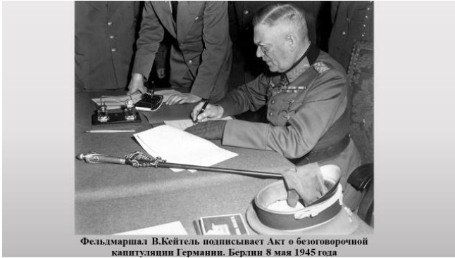
Фельдмаршал В.Кейтель подписывает Акт о безоговорочной капитуляции Германии. Берлин 8 мая 1945 года

В полночь 8 мая 1945 года в предместье Берлина Карлсхорсте представители германского верховного командования подписали акт о безоговорочной капитуляции.