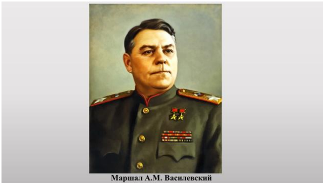
Маршал А.М. Василевский

Выполняя союзнический долг, СССР объявил войну Японии и 9 августа 1945 года начал военные действия, в ходе которых была разгромлена японская Квантунская армия, ликвидирован очаг агрессии на Дальнем Востоке, освобождены Северо-Восточный Китай, Северная Корея, Сахалин и Курильские острова. Япония капитулировала, война завершилась.