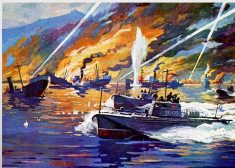
Атака торпедных катеров в ходе Маньчжурской операции. Художник Г.А.Сотсков