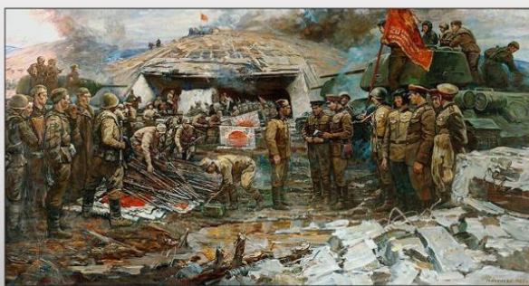
М. А. Ананьев. «Капитуляция Квантунской армии»