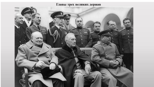
Главы трех великих держав