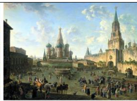
Московский Кремль конец XVIII века

Задание 3. Прочитайте текст в рабочем листе и ответьте на вопросы.