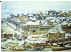
Московский Кремль при Иване Калите