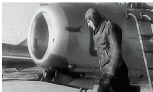
Георгий Береговой после выполнения боевого задания