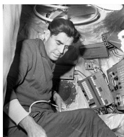
Подготовка к космическому полету