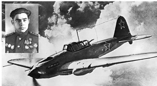
Самолет Ил-2 летчика Георгия Берегового