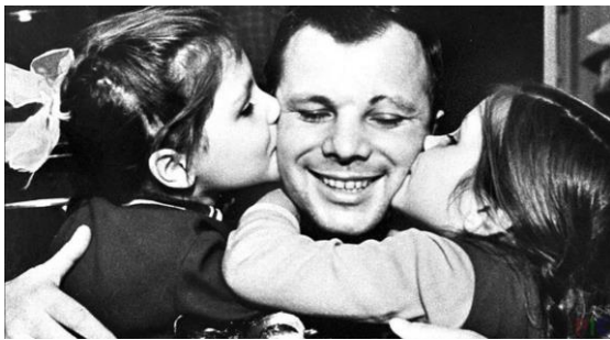
Ю.А.Гагарин с дочерьми