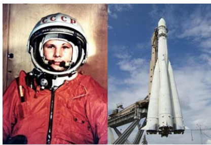
Первый космонавт планеты