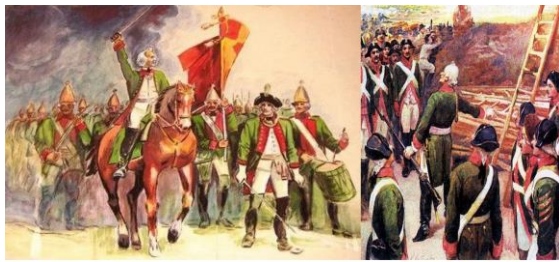
А.В. Суворов обучает солдат

Задание. Проанализируйте соотношение сил перед штурмом крепости, сравните и сделайте вывод.