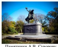
Памятники А.В. Суворову Измаил