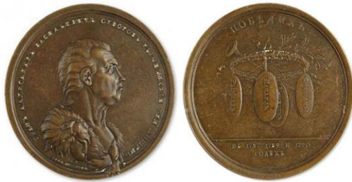
Именная медаль «В честь Графа А.В. Суворова-Рымникского», 1790 год

Было подтверждено присоединение Крыма к России, и установлена русско-турецкая граница по реке Днестр, то есть всё Северное Причерноморье от Днестра до Кубани было закреплено за Россией.