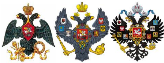
Малый государственный герб