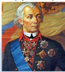
Итальянский поход Александра Васильевича Суворова в 1799 году