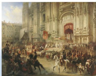
Торжественная встреча А.В. Суворова в Милане в апреле 1799 года художник А. Шарлемань

– В чем проявилось значение победы русских войск в битве при Нови для Итальянского похода 1799 г.?