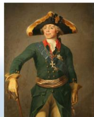
Император Всероссийский Павел I