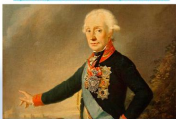
Видеофрагмент «Итальянский поход Александра Васильевича Суворова 1799 г.» https://www.youtube.com/watch?v=7TbjfD91EZ4&t=113s

*Задание 6.2. Просмотрите фрагмент видеоролика «Итальянский поход Александра Васильевича Суворова 1799 г.» касательно битвы при Нови (интервал 30 мин. 05 сек. – 35 мин. 03 сек.) и ответьте на вопросы в рабочем листе.