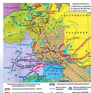
Итальянский поход Александра Васильевича Суворова в 1799 году