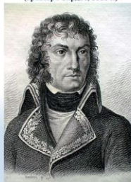
Генерал Бартеlemi Жубер (гравюра Тарлье, 1818 г.)