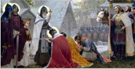
«Следует тебе, господи, заботиться о порученном тебе Богом славном христианском стаде. Иди против безбожных, и если Бог поможет тебе, ты победишь и невредимым в свое отечество с великой честью вернешься». Епифаний Премудрый «Жития преподобного Сергия»

Как вы думаете, какой смысл вложил автор высказывания в свои слова?