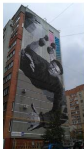
Фасады домов в городах Москва и Самара