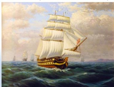
Панасенко С.П. «Линейный корабль "Святой Павел". Флагманский корабль Ушакова»

Задание 4. Прочитайте фрагмент текста и ответьте на вопросы.