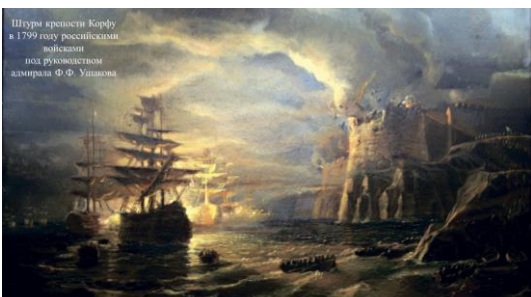
Штурм крепости Корфу в 1799 году российскими войсками под руководством адмирала Ф.Ф. Ушакова

Задание 5. В рабочем листе прочитайте тексты и выполните задание.