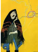
Плакат Потеряла я колечко... (а в колечке 22 дивизии)

Год выпуска: 1943 Художники: «Кукриниксы» Бумага, тушь, гуашь Государственная Третьяковская галерея