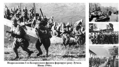
Полкразведки 3-го Белорусского фронта форсирует реку Дукля. Июль 1944 г.

2. Какое значение имела операция «Багратион» в ходе военных действий 1944 года?