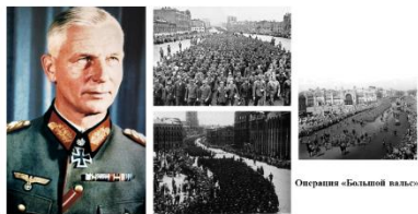
Курт фон Типпельскирх

2. С опорой на данные таблицы объясните мнение Алана Кларка.