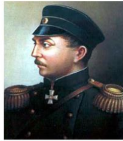
Адмирал П.С. Нахимов 1802-1855

Знаменательной победой Ушакова было взятие острова Корфу в феврале 1799 года, где успешно использовались комбинированные действия кораблей и сухопутного десанта. Адмирал Ушаков провел 40 морских сражений . И все они завершились блестящими победами. В народе его называли флотским Суворовым.