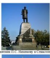
Памятник П.С. Нахимову в Севастополе