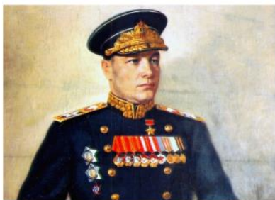
Адмирал Флота Советского Союза Н.Г. Кузнецов 1904 - 1974

Два “морских” ордена - Ушакова и Нахимова, а также две соответствующие “морские” медали были учреждены 3 марта 1944 года.