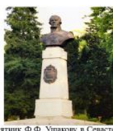
Памятник Ф.Ф. Ушакову в Севастополе

– Сравните статуты и описание наград РФ с наградами СССР. Сделайте вывод.