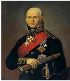
Адмирал Ф.Ф. Ушаков 1745-1817