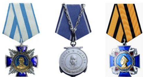
Орден Ушакова Медаль Ушакова Орден Нахимова

– Опишите медаль Ушакова, используя приведенную терминологию.