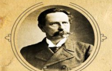
Карл Бенц 1885 год Германия

Тип кузова: мотоколяска без дверей Число мест - 2