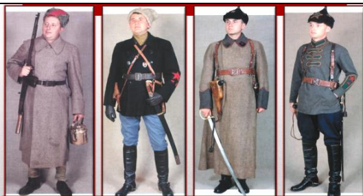
Реконструкция формы красноармейцев 1918- 1936 гг.

В чём, по мнению автора плаката, принципиальное отличие между царской армией и РККА?