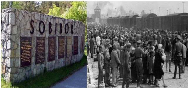
Лагерь смерти «Собибор»

«Утром 2 октября началось наступление немецких войск на Москву. Операция «Тайфун» оказалась неожиданностью для Ставки Верховного командования. Сталин не дал вовремя разрешения отойти, и к 6 октября четыре армии, в том числе и 19-я (в общей сложности полмиллиона красноармейцев), попали в окружение западнее Вязьмы. Помощи они не получили. Погибли или оказались в плену, как генерал Лукин. Лейтенант Печерский вместе с другими бойцами вынес из боя раненого комиссара полка. Там же, в Вяземском котле, осенью 1941 года Александр был ранен и попал в плен. Переболел тифом, выжил и уже в мае 1942-го предпринял первую попытку побега, которая окончилась неудачно: четверых беглецов поймали и отправили сначала в штрафной лагерь в Борисове, затем перебросили в трудовой лагерь СС в Минске. Во время медосмотра выяснилось, что Печерский еврей, и его увезли в Минское гетто.