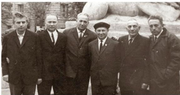
Встреча бывших узников лагеря смерти «Собибор»