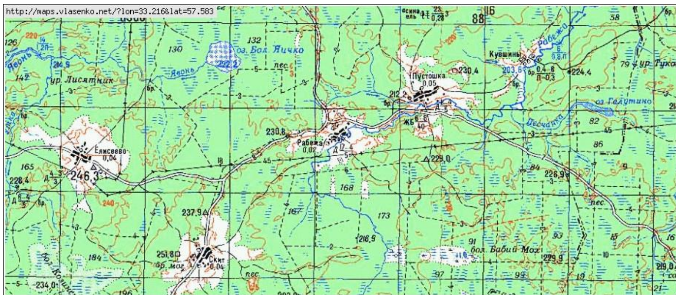
Топографическая карта района