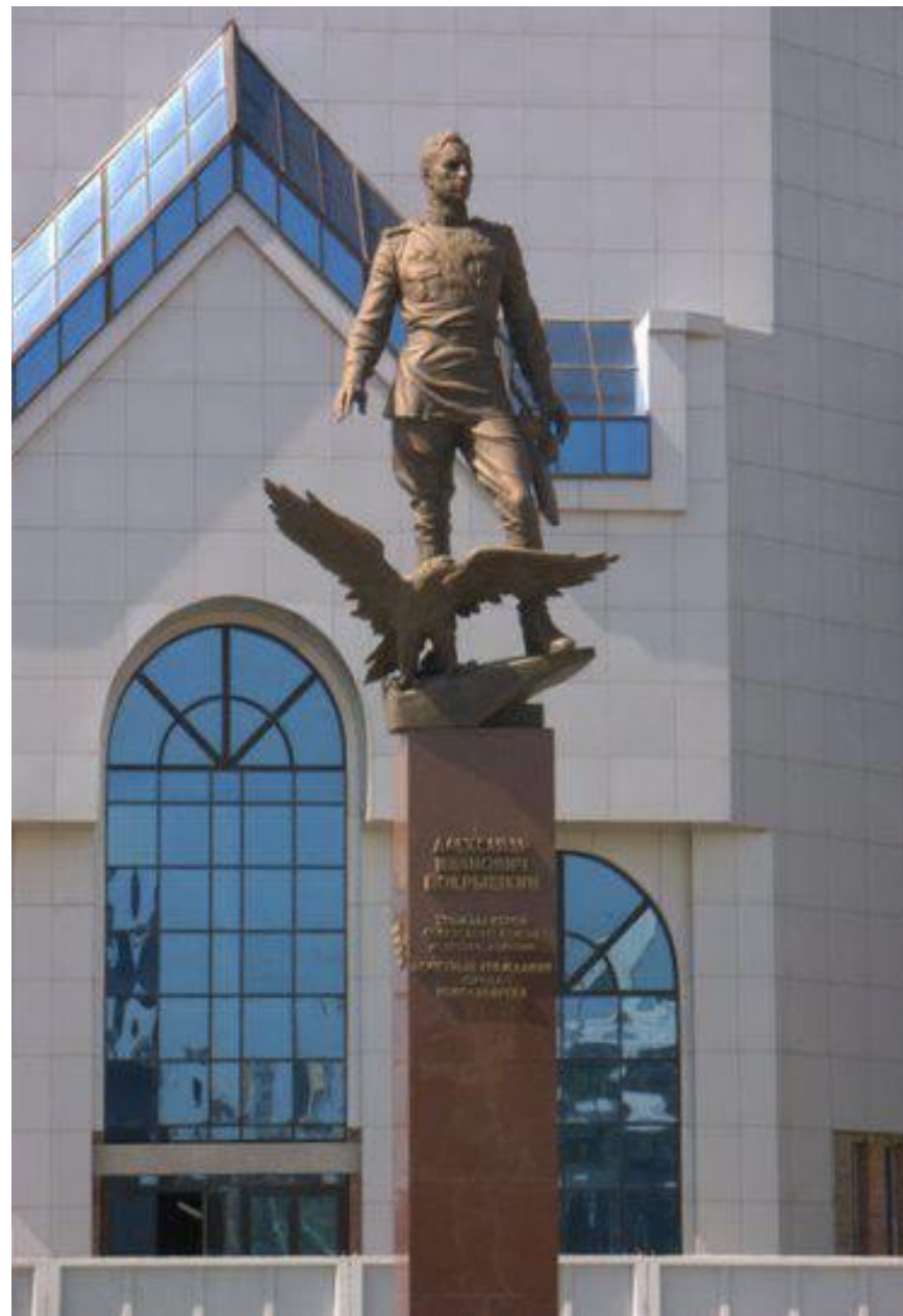
Памятник трижды Герою Советского Союза маршалу авиации Александру Ивановичу Покрышкину на площади Карла Маркса в Ленинском районе города Новосибирска. Скульптор Михаил Переяславец.