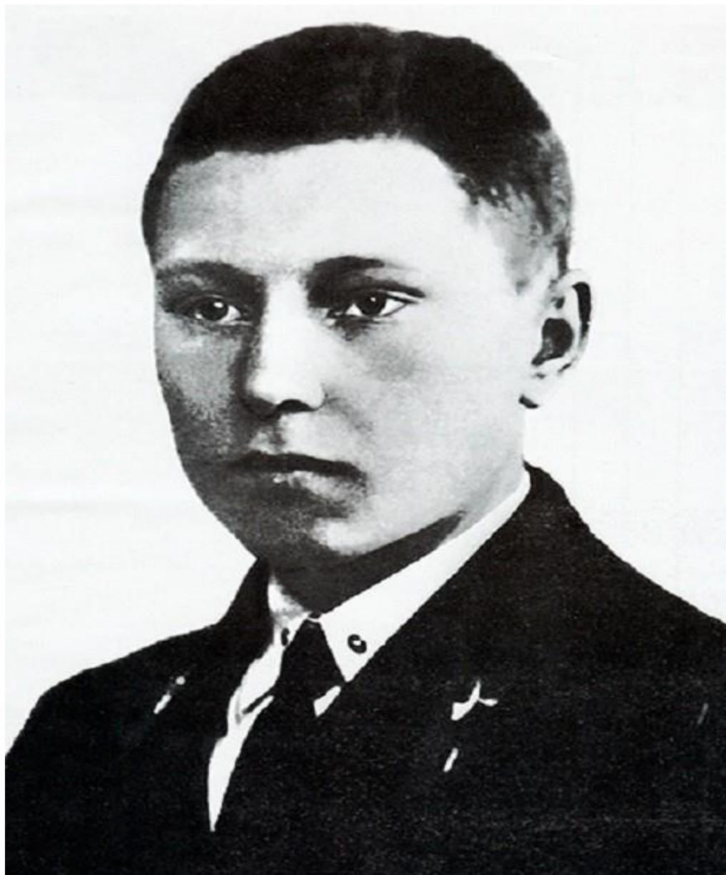
А.И.Покрышкин в юности