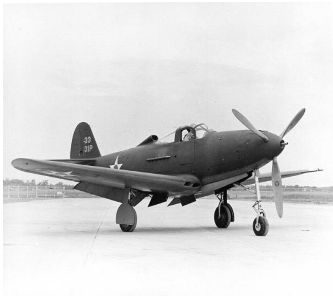
«Аэрокобра» - самолет А.Покрышкина 1943-1944годы