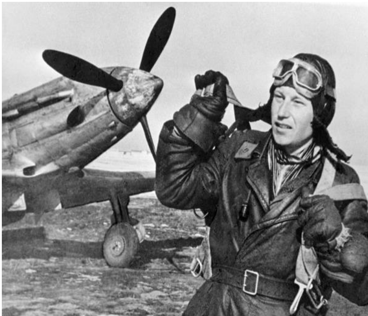
А.Покрышкин у боевого самолета, 1942 год