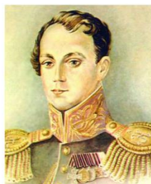
морской офицер Александр Казарский

Победа маленького брига в бою с двумя большими кораблями казалась настолько фантастической, что некоторые специалисты в военно-морском деле отказывались в неё верить. Английский историк военного флота Ф. Джейн, например, говорил: «Совершенно невозможно допустить, чтобы такое маленькое судно, как „Меркурий“, вывело из строя два линейных корабля».