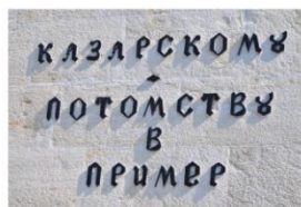
Памятник брига «Меркурий» в Севастополе Открыт в 1839 году. Автор проекта - академик архитектуры А. П. Брюллов (1798—1877).

Одним из примеров мужества и героизма в период русско-турецкой войны 1828-1829 гг. является подвиг экипажа брига «Меркурий» , вступившего в неравный бой 14 (26) мая 1829 г. с двумя турецкими кораблями и вышедшего из этого боя победителем.