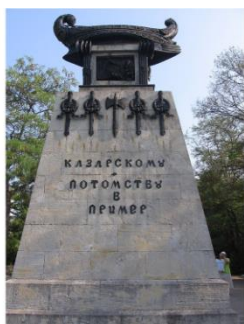
Памятник бригу «Меркурий» в Севастополе Открыт в 1839 г. Автор проекта - академик архитектуры А. П. Брюллов (1798—1877)

Задание. Выполните задание № 7 рабочего листа.