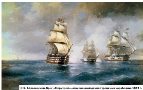
И.К. Айвазовский. Бриг «Меркурий», атакованный двумя турецкими кораблями. 1892 г.

Имя Казарского было на устах у всей России. Еще вчера скромный морской офицер, не окончивший даже Морского корпуса, он в один день стал национальным героем. Подвиг «Меркурия» вдохновлял художников и поэтов.