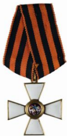
орден Святого Георгия 4-й степени

Задание. Посмотрите фрагмент фильма . Выполните задание № 5 рабочего листа.