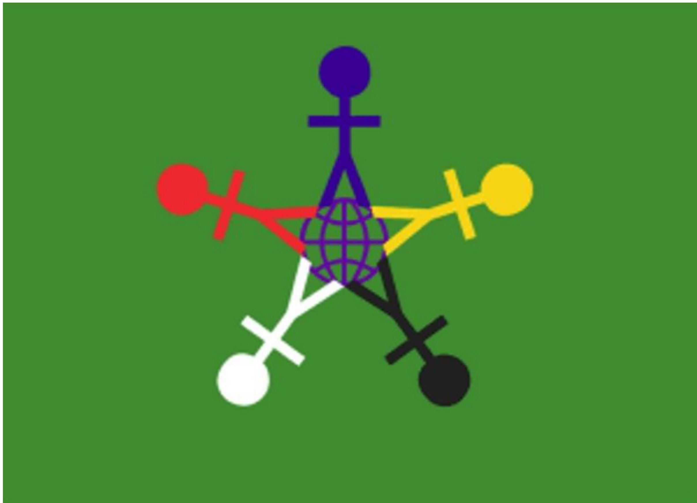
Флаг Международного дня защиты детей