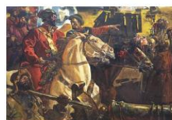
Емельян Пугачев и Бахтияр Кавказ (июль 1774). Художник Виктор Федоров (1962)