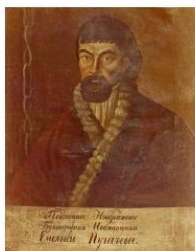
Портрет Пугачева, писанный с натуры масляными красками, надписи на портрете: «Подлинное изображение бунтовщика и обманщика Емельяна Пугачева» (неизвестный художник)

Задание 4. О чем говорит тот факт, что для подавления восстания императрица использовала полководческий авторитет Александра Суворова? Поясните свой ответ.