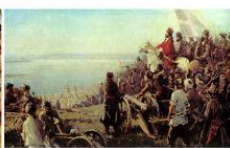
Пугачев на Соколовой горе. Художник Василий Фомичев (1949)