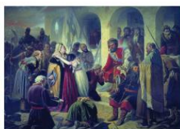
Суд Пугачева. Художник Василий Перов (1879)