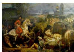
Емельян Пугачев. Художник Виктор Нельяев (1993)