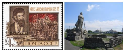
Почтовая марка, посвященная 200-летию Крестьянской войны 1773-1775 годов, Е.И. Пугачев, 1973