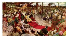
Пугачев в Казани творит суд. Художник Гавриил Горелов (1925)