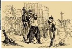
А.В. Суворов помещает Е. Пугачева в клетку. Гравюра по рисунку Т.Г. Шевченко 1850-е гг.

<...> Екатерина II прислала для подавления восстания генерал-поручика Александра Васильевича Суворова. Однако знаменитый полководец к решающим боям уже не успел, и вместо лавров победителя самозванца, ему пришлось довольствоваться ролью его тюремщика. <...>