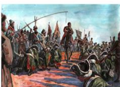
Восстание Пугачева. Художник Олег Леоньев (2006)