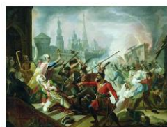
Штурм Пугачева Казани. Художник Федор Моллер (1847)

3. Объясните, почему был вынесен суровый приговор.