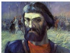
Емельян Иванович Пугачев. Художник Леонид Коринсов