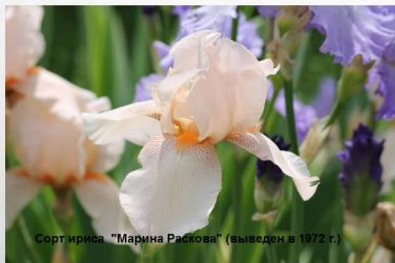
Сорт ириса "Марина Раскова" (выведен в 1972 г.)

Как вы думаете, почему создатель сорта выбрала для него такое название?