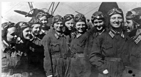
586-ой истребительный (Як-1) 587-ой бомбардировочный (Пе-2) 588-ой ночной бомбардировочный (По-2)