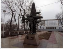
Памятник М.М. Расковой, установленный в г. Энгельсе

Майор М.М. Раскова награждена двумя орденами Ленина, орденом Отечественной войны 1-й степени, медаль "Золотая Звезда". За выполнение беспосадочного перелёта из Москвы на Дальний Восток лётчица указом от 2 1938 года была удостоена звания Герой Советского Союза.