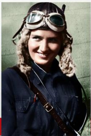
Марина Раскова В 1941 году Марине Расковой было 29 лет