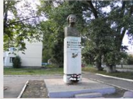
Памятник М.М. Расковой, установленный в г. Тамбове

Майор М.М. Раскова награждена двумя орденами Ленина, орденом Отечественной войны 1-й степени, медаль "Золотая Звезда". За выполнение беспосадочного перелёта из Москвы на Дальний Восток лётчица указом от 2 1938 года была удостоена звания Герой Советского Союза.