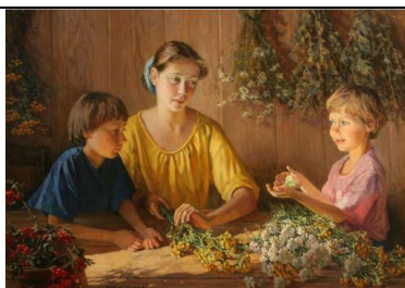
М.В. Чудович. «Дары ульяниного лета», 2000 год

Задание 6. Прочитайте притчу «Любимый сын».