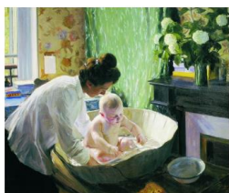
Б.М. Кустодиев. «Утро», 1904 год. Государственный Русский музей

Младенческая «речь» в какой-то мере просто игра. Но родители считают иначе. Ребёнок произносит мама, а звучит это, как будто он кого-то зовёт. И этот кто-то, как правило, – его мать, которая больше всех заботится о ребёнке. Она воспринимает звуки ма-ма-ма-ма-ма как обозначающие её и, в свою очередь, использует их в разговорах с ребёнком, называя себя. Так набор звуков мама получил значение мать. Это могло происходить с первобытными людьми. Более того, это произошло по всему миру, независимо от языка общения. Это означает, что даже после того, как праязык распался на множество отдельных, младенцы со своими матерями продолжали снова и снова воссоздавать слово мама.