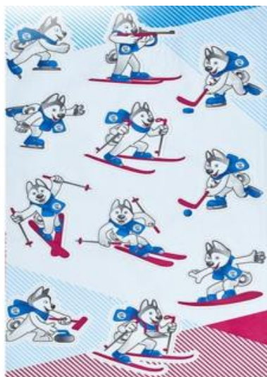
Талисман Зимней универсиады -2019

Посмотрите изображения на слайде и выполните задание.