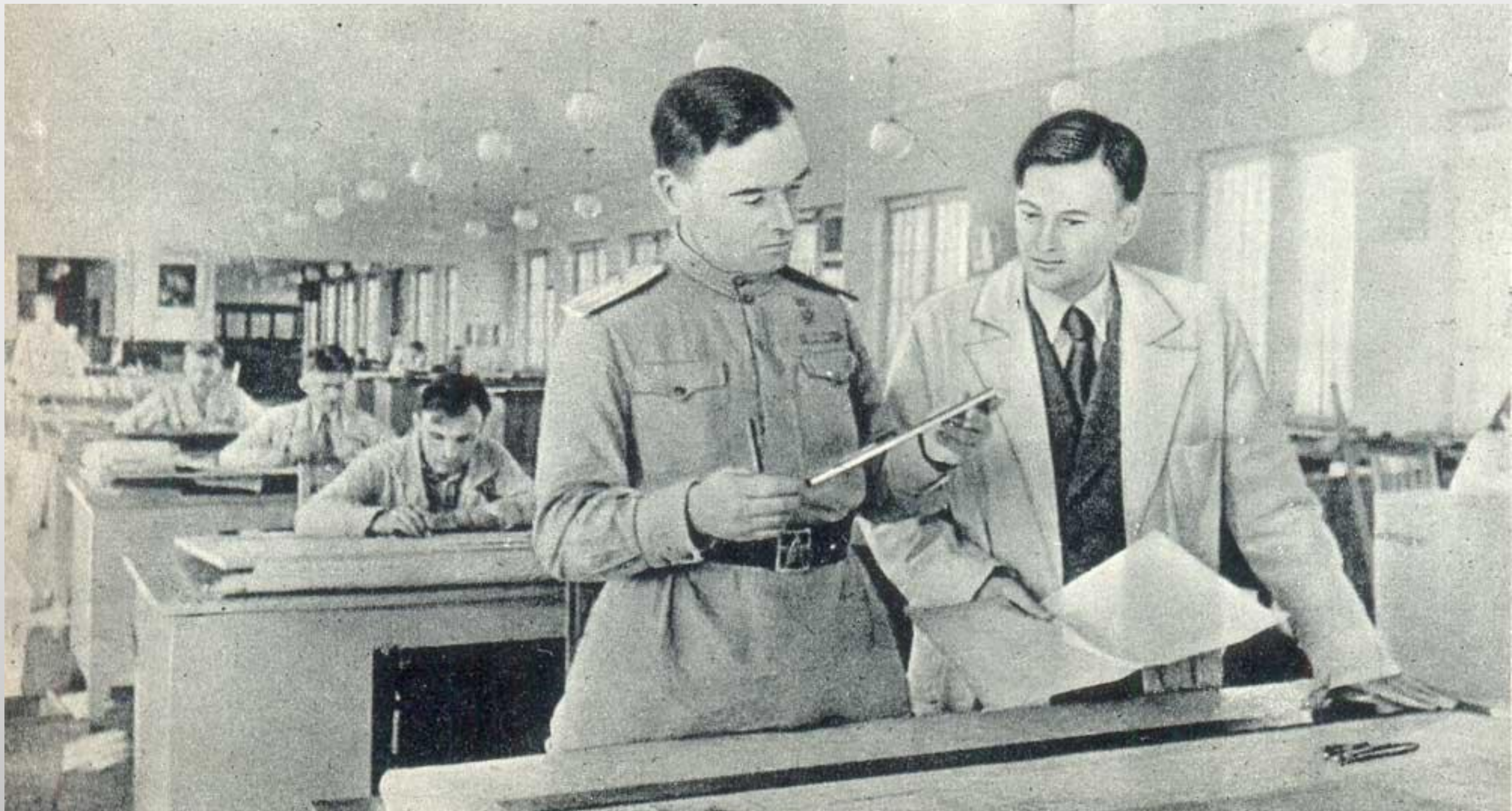
Конструкторы А.С. Яковлев и О.К. Антонов в конструкторском бюро, 1943 г.