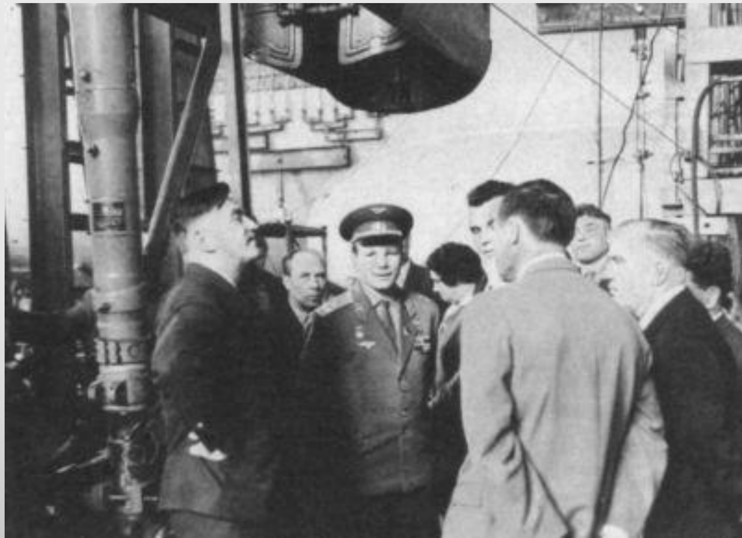
Юрий Гагарин в гостях у Генерального, 26 апреля 1966 г.