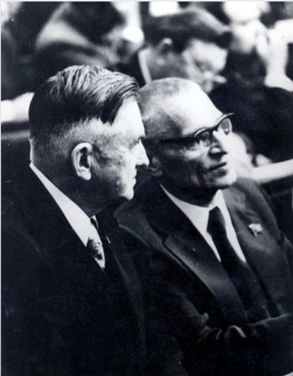
О.К. Антонов и Н.М. Амосов на заседании Верховного Совета СССР