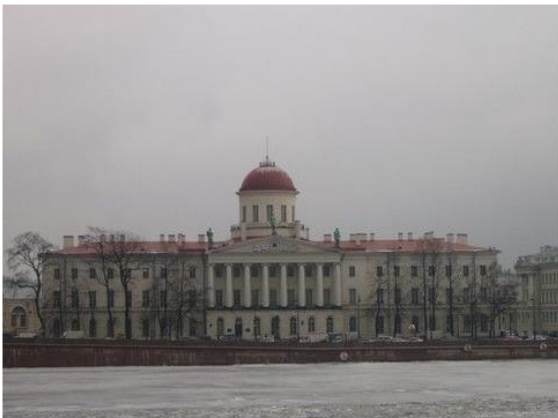
Пушкинский дом, в котором служил Д.С. Лихачев

Пушкинский дом – Институт русской литературы Российской академии наук— научное учреждение. Создан 15 декабря 1905 года по инициативе ряда деятелей русской культуры.