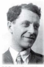
Д.С. Лихачев. Фото 1936 г.