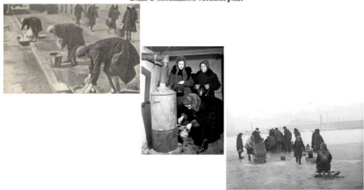
Вода в блокадном Ленинграде