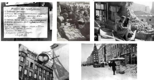
В блокадном Ленинграде