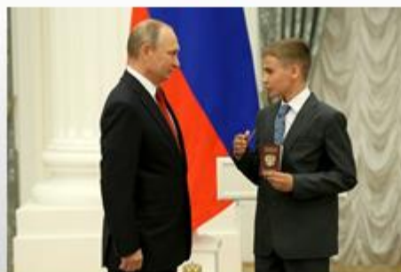
Вручение общегражданских паспортов детям в Кремле