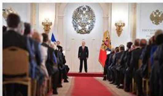
Церемония вручения государственных премий в Кремле