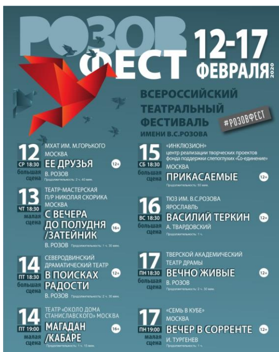
Афиша Всероссийского театрального фестиваля «Розовфест» на сцене Ярославского ТЮЗа

Задание 8. Рассмотрите афишу в рабочем листе, выполните задания.