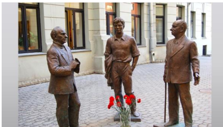
Памятник трем драматургам