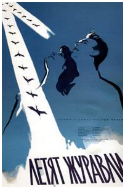
Афиша фильма «Летят журавли»

Виктор РОЗОВ, драматург, доброволец дивизии народного ополчения