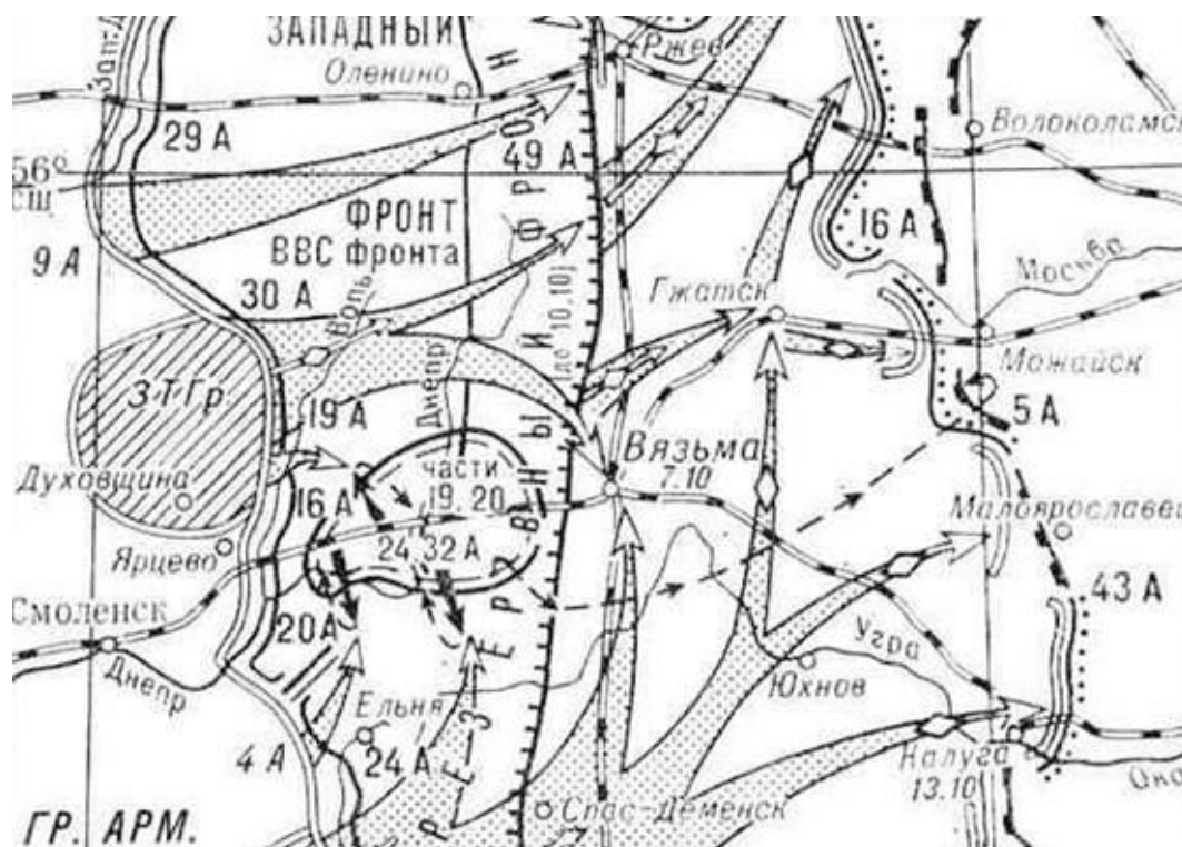
Вяземская оборонительная операция 2-13 октября 1941 г. Карта Министерства обороны Российской Федерации

Архитектурно - художественное решение. Адрес: г. Москва, САО, р-он Сокол, сквер на ул. 2-я Песчаная, напротив д. 3. Архитектор А.И. Воскресенская, скульпторы А.Д. Чебаненко, М.В. Баскаков, ООО «МЦ «ЛАД», Москва, 2017.