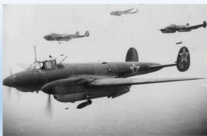
Самолеты Пе-2 в воздушном бою

Heinkel He 111 – немецкий средний бомбардировщик, один из основных бомбардировщиков люфтваффе. Всего было построено более 7600 He 111 разных модификаций, что делает этот самолёт вторым по массовости бомбардировщиком.