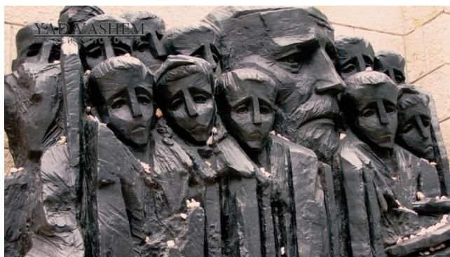
Памятник детям-жертвам Холокоста

7. Что хотел сказать мировому сообществу автор памятника, изображенного в рабочем листе? Какие чувства вызывают у вас памятники детям-жертвам войны?