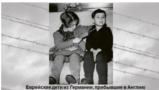
Еврейские дети из Германии, прибывшие в Англию

Какие методы воспитания немецкой молодежи применялись нацистскими преступниками по отношению к еврейским детям?