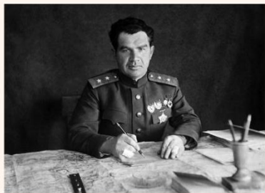
В.И. Чуйков за рабочим столом