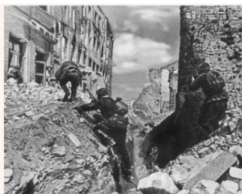
Пример действия штурмовой группы Красной Армии