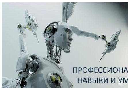
ПРОФЕССИОНАЛЬНЫЕ НАВЫКИ И УМЕНИЯ

Бурно развивается индустрия красоты, и в связи с этим особой популярностью пользуются такие профессии, как стилисты, визажисты, парикмахеры.