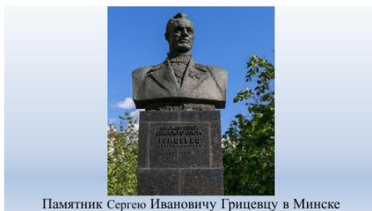
Памятник Сергею Ивановичу Гриצעву в Минске

Задание 5. В рабочем листе прочитайте текст и ответьте на вопросы.