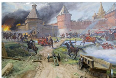
Диорама «Осада Тульского кремля войсками крымского хана Девлет Гирея». Студия военных художников Грекова

Каменный кремль стал серьезным препятствием для татарских полчищ, стремившихся пробраться в глубину Московского княжества, а Тула была пограничным городом.