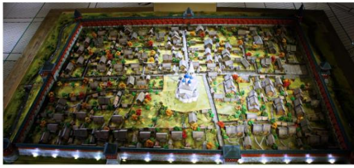
Макет Тульского кремля, реконструирующий его облик конца XVI-первой половины XVII века. Экспозиция музея «Тульский кремль»

Но государство крепло, расширяло границы, и значение кремля как оборонительного сооружения постепенно утрачивалось. В XVII-XVIII веке это был уже правительственный центр города. Здесь находились гражданско-административные учреждения, уголовный суд. А в середине XIX века кремль освободили от хозяйственных, правительственных построек. В начале XVIII века Тула вольготно раскинулась по обоим берегам Упы, разделенная ее руслом на Заречье и старый город. Возле Заречья выросла Чулковская слобода, позже присоединенная к Туле и ставшая третьей городской частью. Крепостные сооружения старого города, давно утратившие свое оборонное значение, ветшают и разрушаются. Стены дубовой крепости разбирали на городские и личные нужды, Земляной вал был срыт. Старых деревянных церквей к этому времени тоже почти не осталось. Им на замену на средства купечества были выстроены каменные храмы.