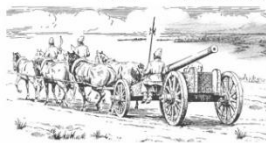
Русское артиллерийское орудие XVII века на конной тяге