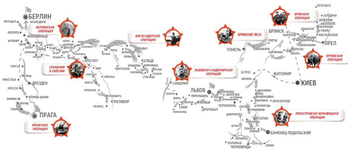
Боевой путь УДТК