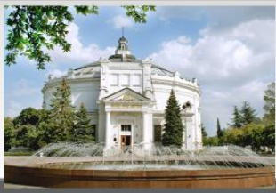
«Великий памятник русского народа» Панорама «Оборона Севастополя 1854-1855 гг.»

При создании фильма его авторы как основу сюжета использовали живописное полотно панорамы первой обороны Севастополя.