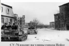
СУ-76 входит на улицы города Нейсе