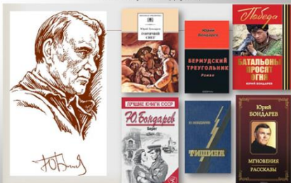
Книги Юрия Бондарева