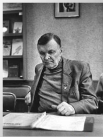
Писатель за работой