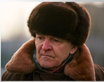
Юрий Бондарев в наши дни

4. Познакомьтесь со списком наград Юрия Бондарева. Сделайте выводы о вкладе в отечественную и мировую литературу писателя. Аргументируйте свой ответ.